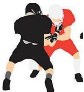
IMMAGINE 3 - ESEMPIO DE POSTO DAVANTI AL CENTRO

Spalla interna del DE in linea con la spalla esterna del C